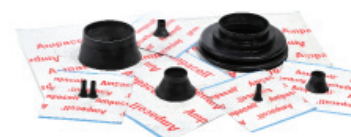
Ampacoll® Elektro / Install