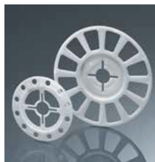
Arandela EJOT combi VT 90 y SBL 140 plus página 32

Una amplia gama de accesorios está disponible para los productos EJOT H3: